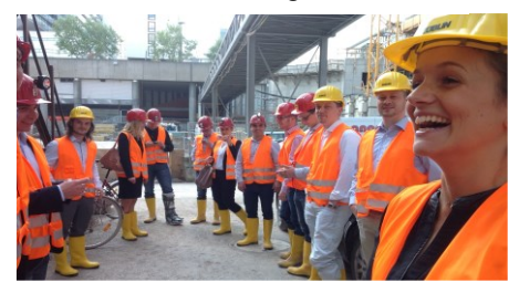
Exkursion Stuttgart 21