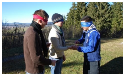
Teamtraining im Allgäu